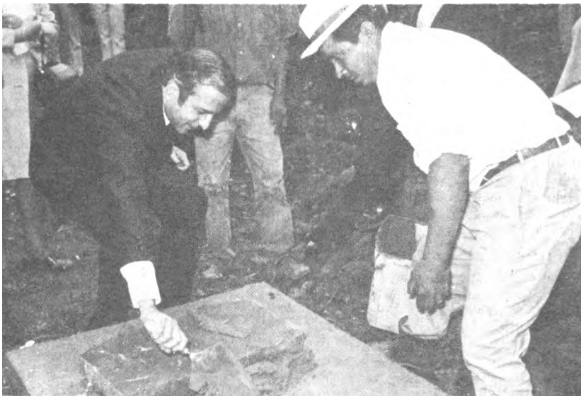
La primera piedra del edificio que será construido para el Colegio de Psicología de la Facultad de Filosofía y Letras, fué colocada por el Rector de la UNAM, doctor Pablo González Casanova, durante un acto efectuado recientemente.