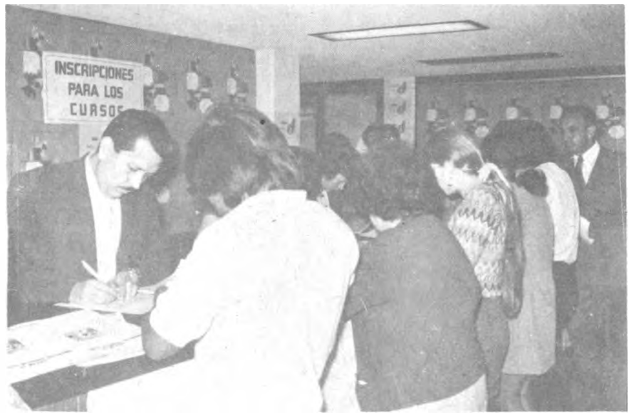
Inscripciones a los cursos del "Programa de Capacitación Intensiva" en la Dirección General de Personal Académico y Administrativo.