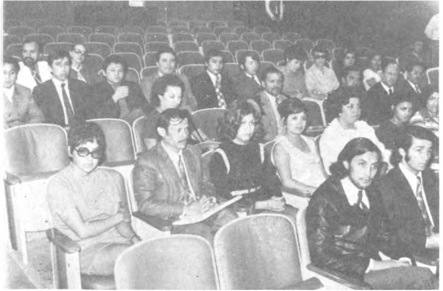
Ceremonia de entrega de diplomas a los participantes en el III Curso del Programa de Formación de Supervisores.