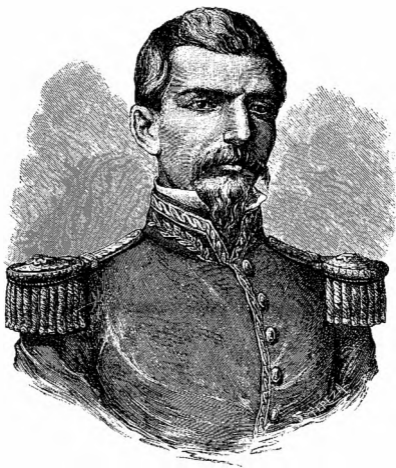
GENERAL LUIS G. OSOLLO.