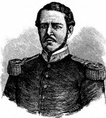
DON FÉLIX ZULOAGA.