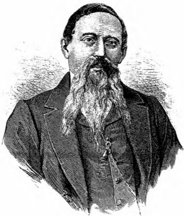
GENERAL D. MARTÍN CARRERA,