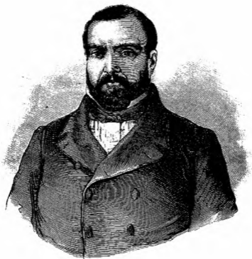
DON IGNACIO COMONFORT.