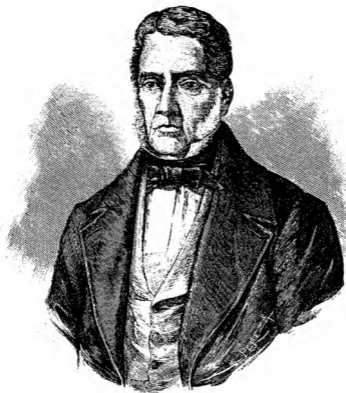
GENERAL D. JUAN ALVAREZ.