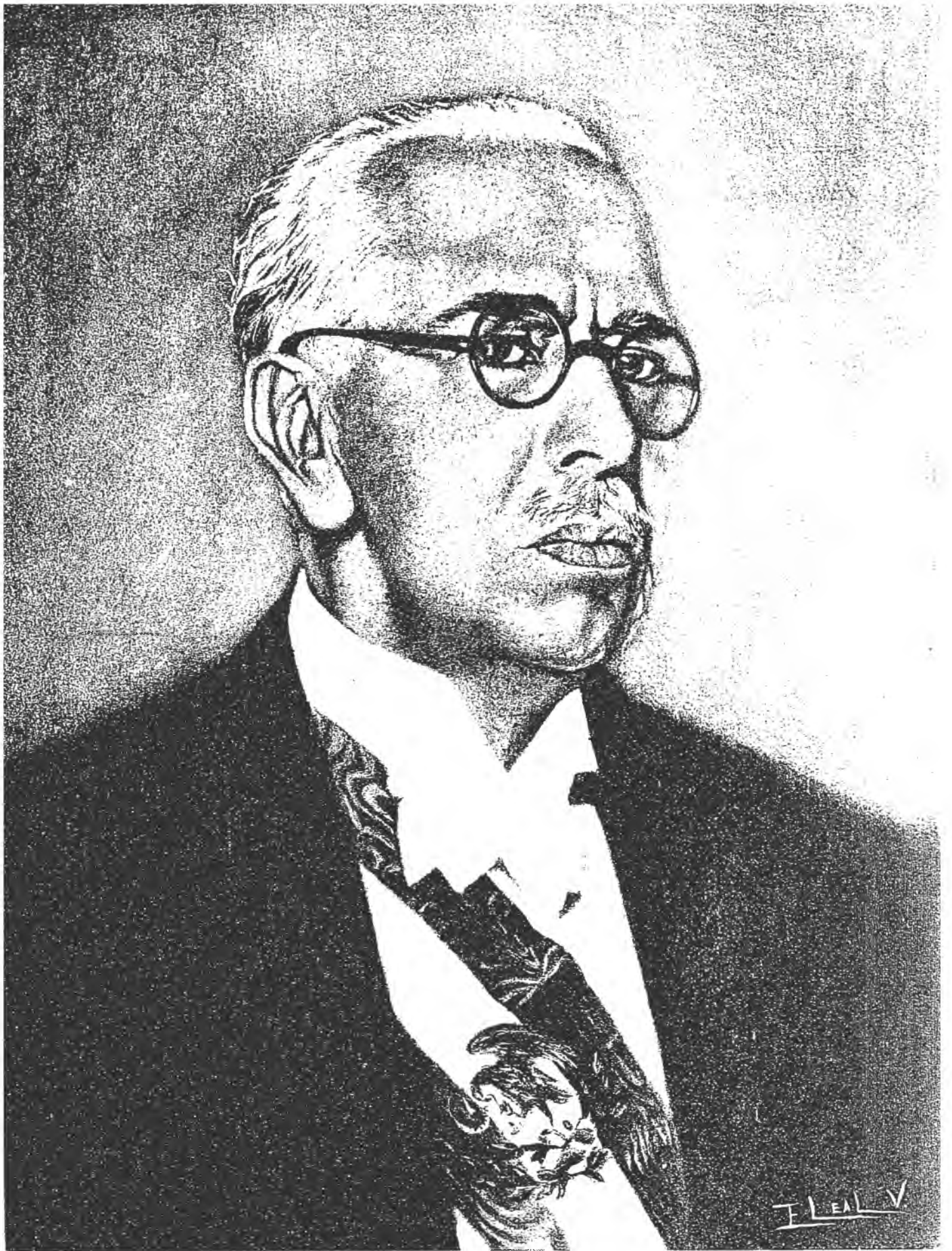
ING. Y GRAL. PASCUAL ORTIZ RUBIO