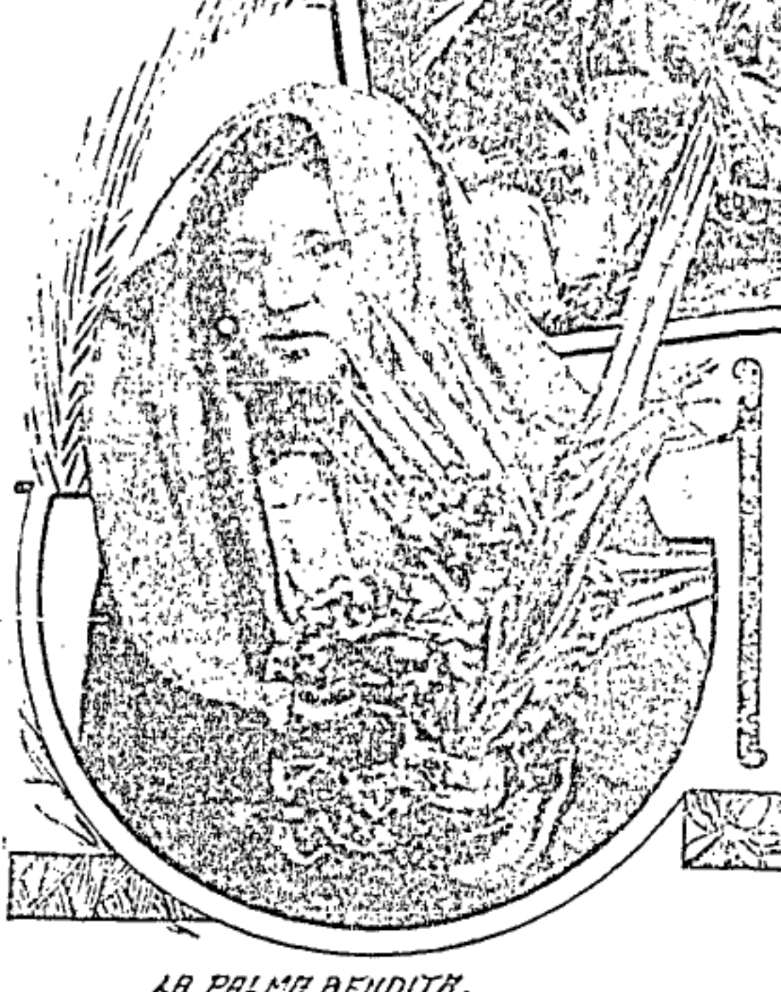
LA PALMA BENDITA.

LA Suntuosa ceremonia de la bendición de las palmas hizo evocar ayer todo el sagrado episodio: el mazahero salvando a las doncellas formidables desde cuyo alto lo espada la maldad de los proceres del Sannedrín.