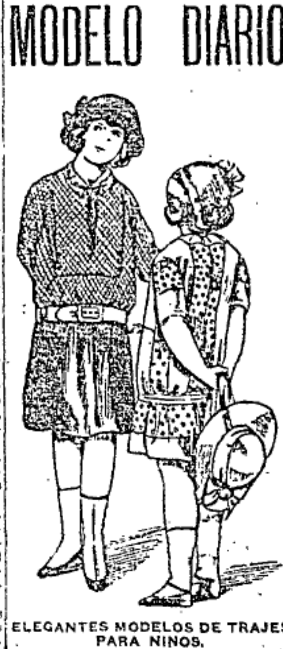
ELEGANTES MODELOS DE TRAJES PARA NIÑOS.