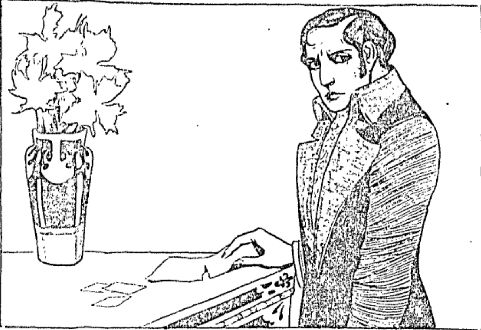
Ilustrado por Carlos D. NEVE.