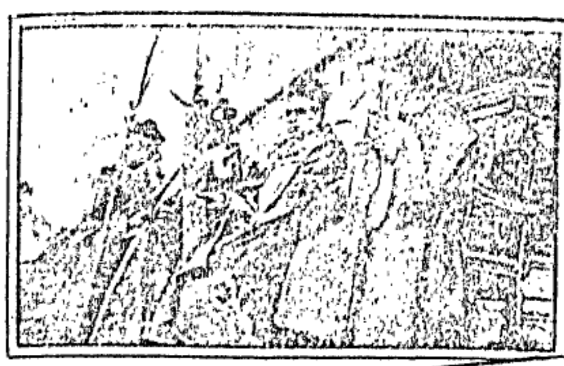
EL ACTO SOLEMNE DE LA BENDICION DE LAS PALMAS

BENDITO SEA EL QUE VIENE EN EL NOMBRE DEL SEÑOR, REY DE ISRAEL.....!