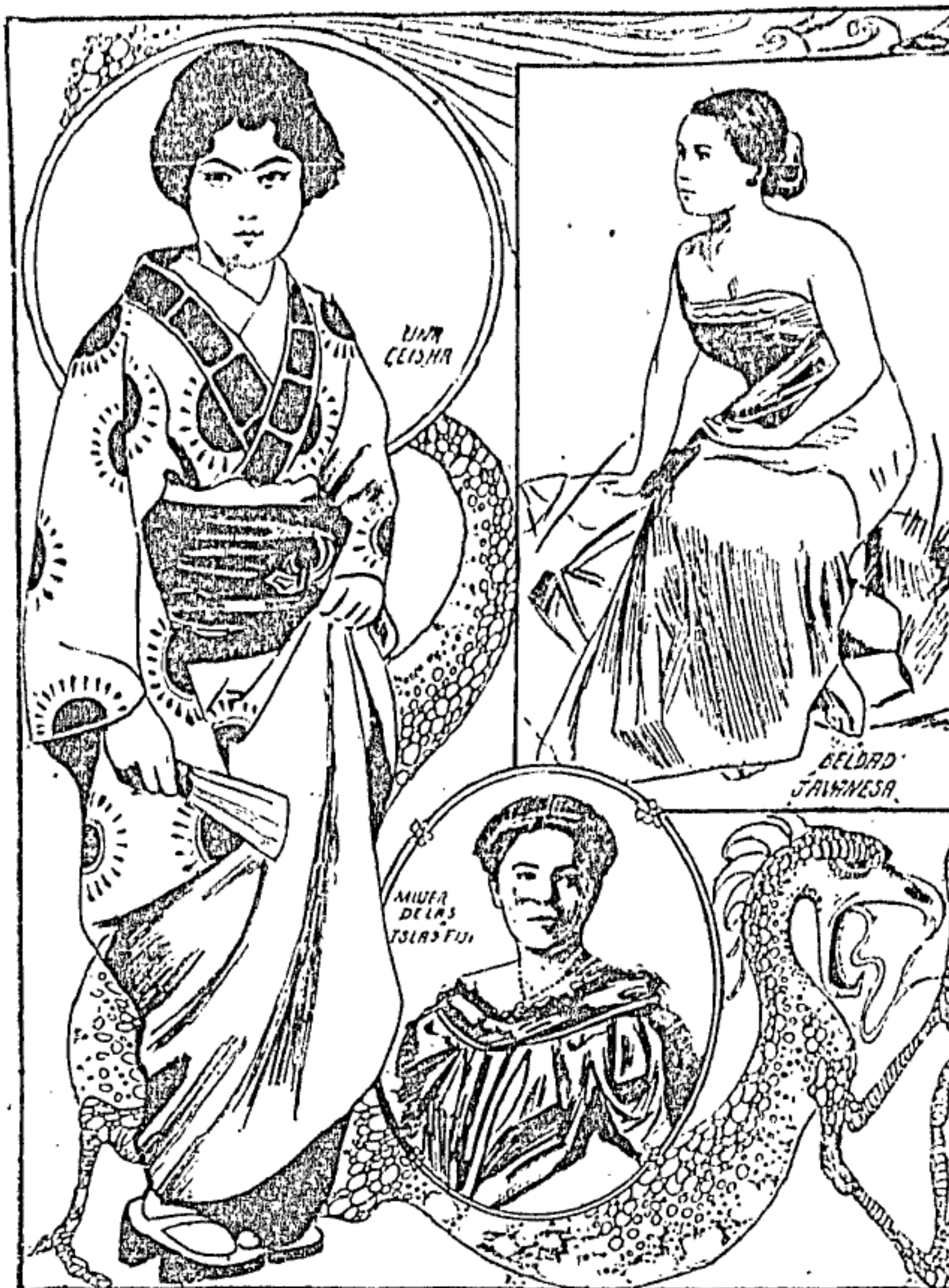
La belleza de la mujer varía según cada nación; pero ahora, en eso, están los japoneses de moda. Muy pronto no quedará nada del pintoresco traje que ha sido uno de los atractivos de aquellas mujeres. La mujer japonesa de la clase elevada importa hoy vestidos de París; pero, sin embargo, la geisha sigue todavía vistiendo el traje que la ha hecho popular en el mundo entero. No se comprenden sus graciosos movimientos si se la viera vestida de otra manera.

—¿Ah, por fin trajó usted el perro! ¡Muy bien! Desde que se fué usted, la policía no ha descansado un momento tomando medidas preventivas. Han detenido a Tadeo, al portero, al ama de llaves, al criado indio, a todo el mundo. La casa está sola completamente, nos pertenecen en absoluto; únicamente arriba ha quedado un agente; deje usted el perro por ahí y suba usted conmigo.