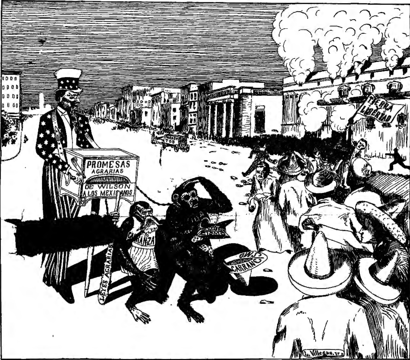
Comprendiendo Wilson que la Intervención es absolutamente antipática al pueblo mexicano, tuvo la ocurrencia de halagarlo cantándole una cancióncilla que va poco más o menos como sigue: "Pueblo querido, te amo con toda mi alma y estoy decidido a darte la tierra que quieres; pero sé bueno, respeta a mis changuitos que se han bañado al son que les toco, permíte que mis soldados lleguen a la ciudad de México y pondré el sol, la luna y las estrellas a tu disposición." El pueblo indignado apertrea a los changuos y levanta la Bandera Roja de Tierra y Libertad, incendia los palacios de los parásitos burgueses, pone en libertad a los presos incendiando los presidios, quema los títulos de propiedad declarando que todo debe pertenecer a todos y pone los cimientos del nuevo orden social en que no hay más amos, gobernantes ni embaucadores religiosos.