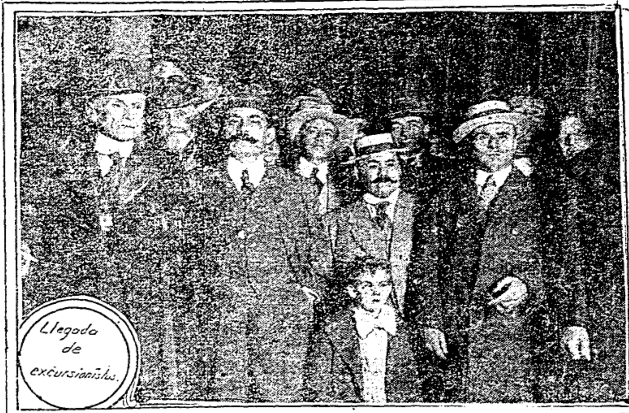
Llegada de excursionistas.

ESTA FORMADA POR PROMINENTES BANQUEROS, COMERCIANTES, INDUSTRIALES, AGRICULTORES Y PERIODISTAS DE DALLAS, TEXAS