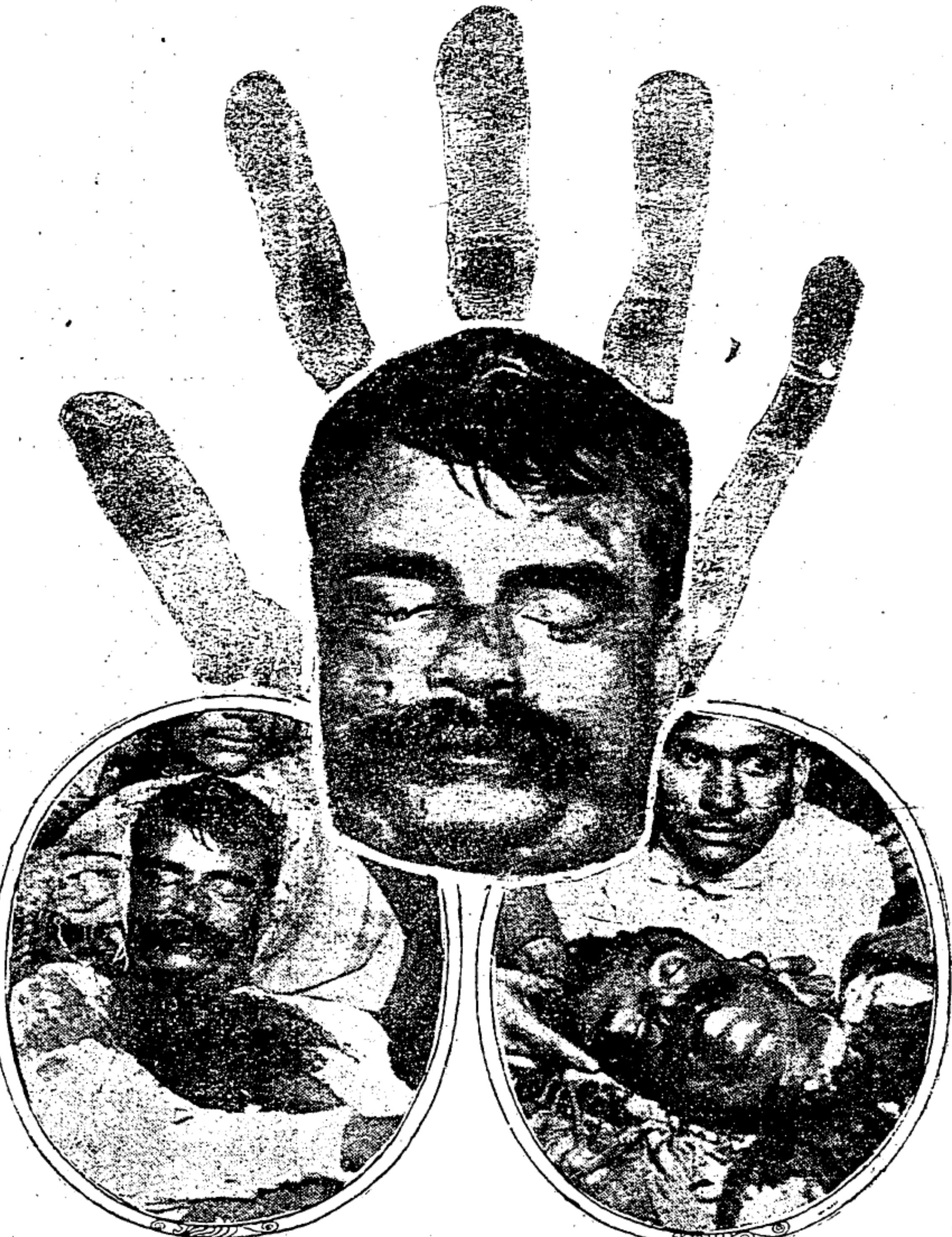
EMILIANO ZAPATA EXPUESTO AL PUBLICO.