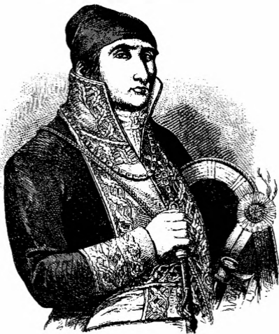
DON JOSÉ MARÍA MORELOS.