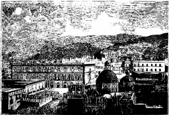
EXTERIOR DE LA ALHÓNDIGA DE GRANADITAS (GUANAJUATO).