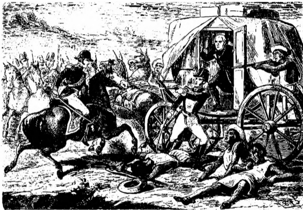
PRISION DE DON MIGUEL HIDALGO