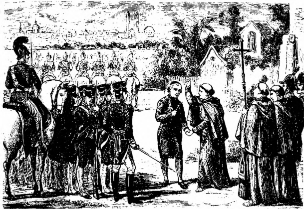
FUSILAMIENTO DE HIDALGO.